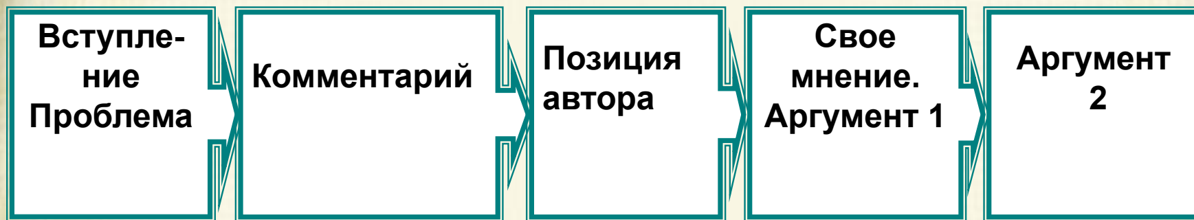
Схема сочинения-рассуждения (часть С)

Как через анализ текста раскрыть авторский замысел?