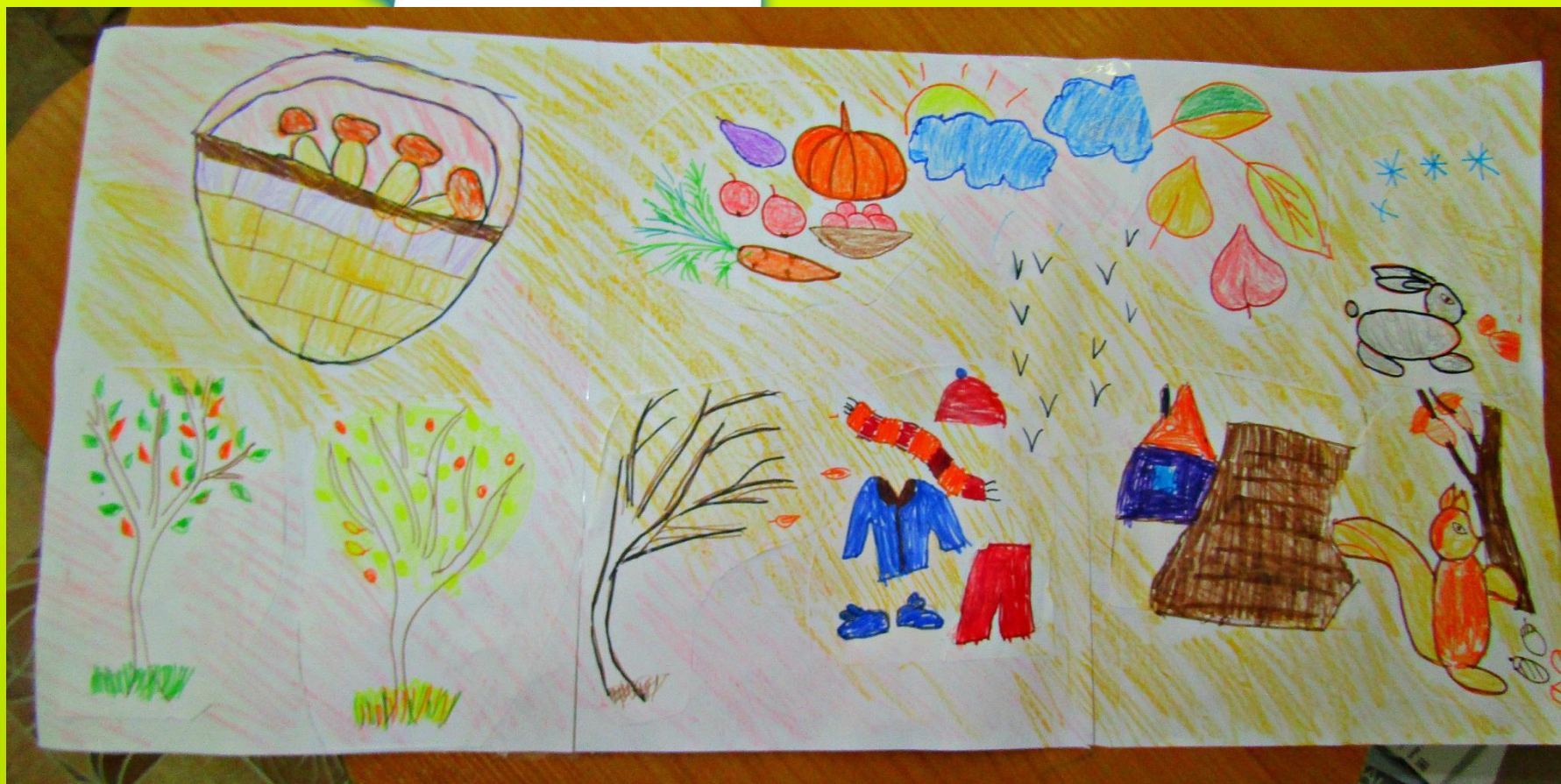
Коллаж изготовленный детьми «Признаки осени»