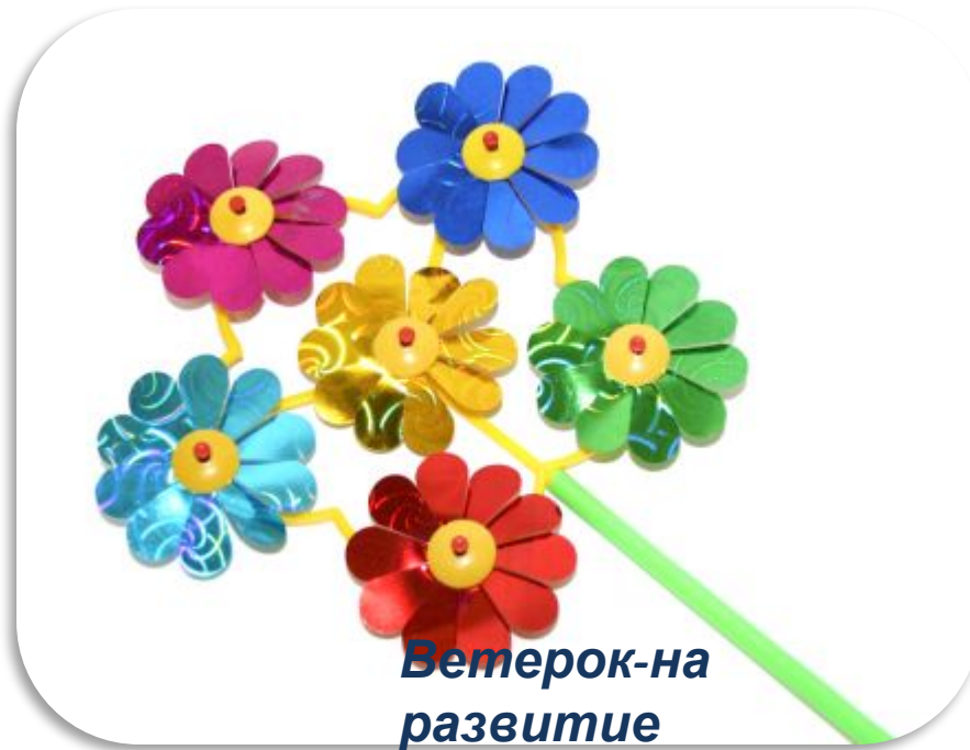
Ветерок-на развитие речевого дыхания