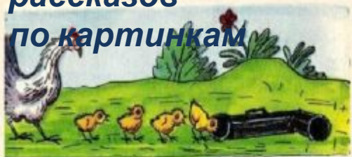
Составление рассказов по картинкам