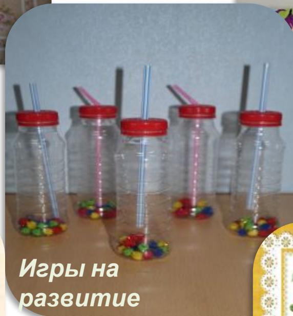
Игры на развитие речевого дыхания