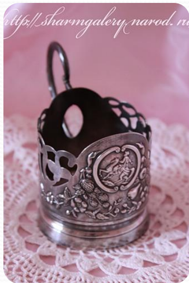
ПОД + СТАКАН + НИК