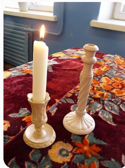
ПОД + СВЕЧ + НИК