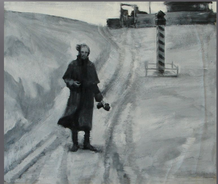
Иллюстрация Игоря Панова