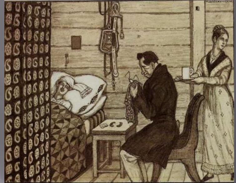
Иллюстрация М. В. Добужинского