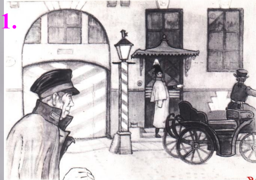
Иллюстрация М. В. Добужинского