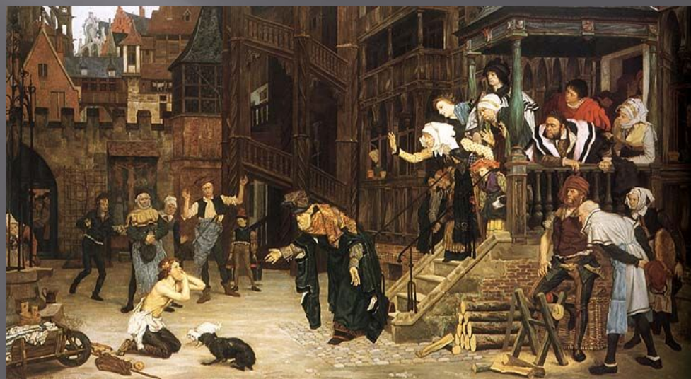
Джеймс Жак Джозеф