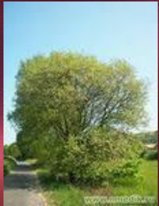
это дерево более пушистое