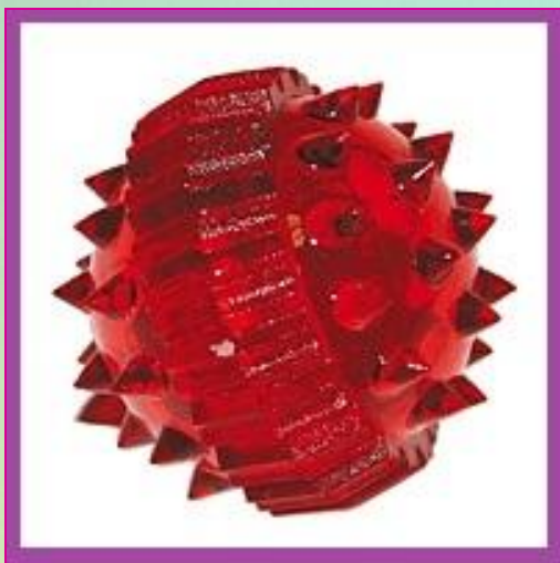
Массажный шарик «Каштан»