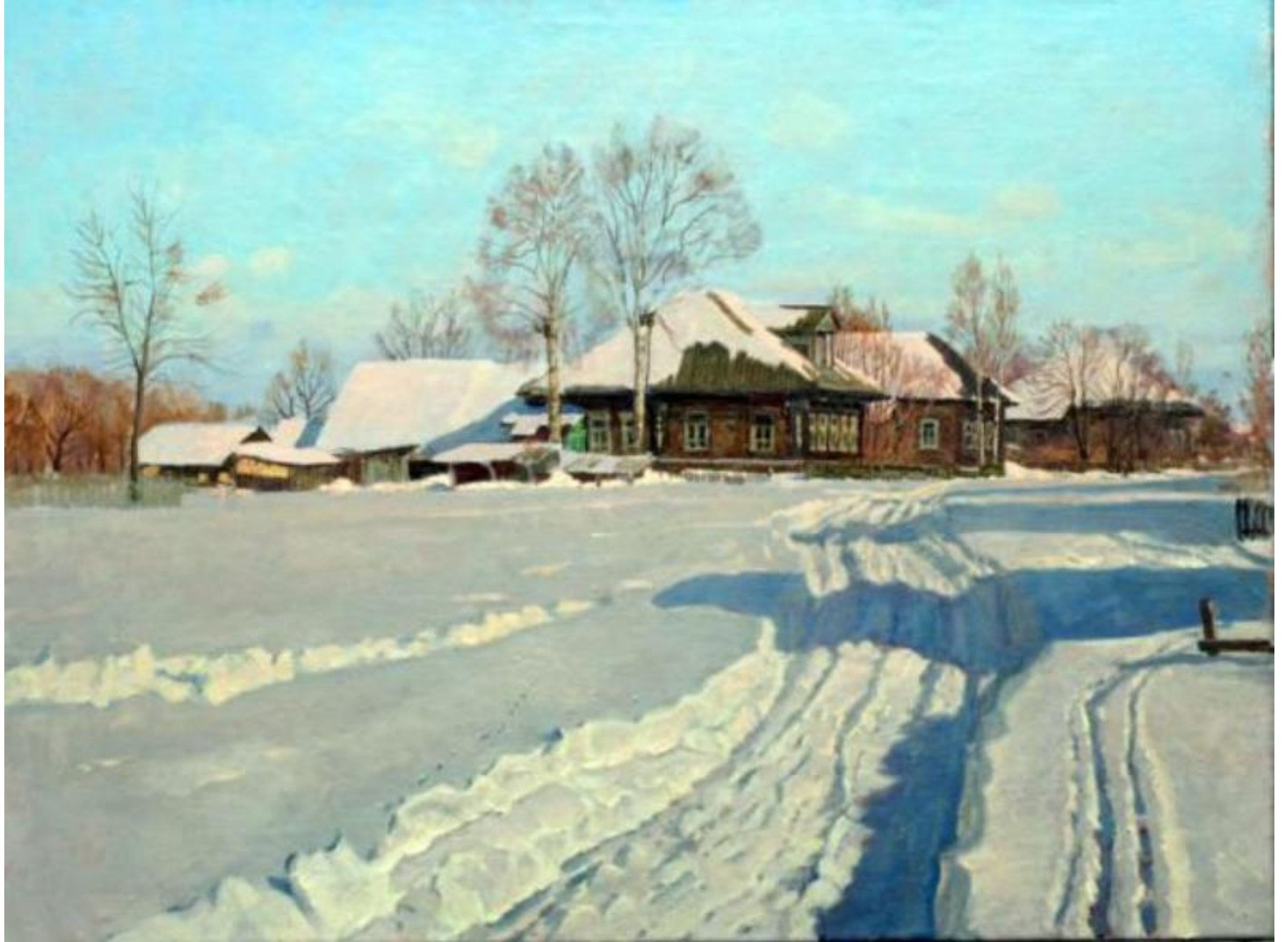
Вот моя деревня,