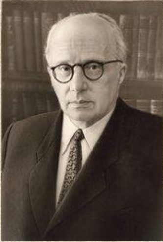
Рубинштейн С. Л.