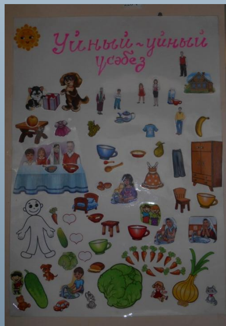
Коллаж “Уйный-уйный үсәбез”