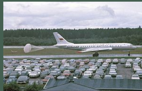
TU - 104

Андрей Николаевич Туполев – русский авиаконструктор.