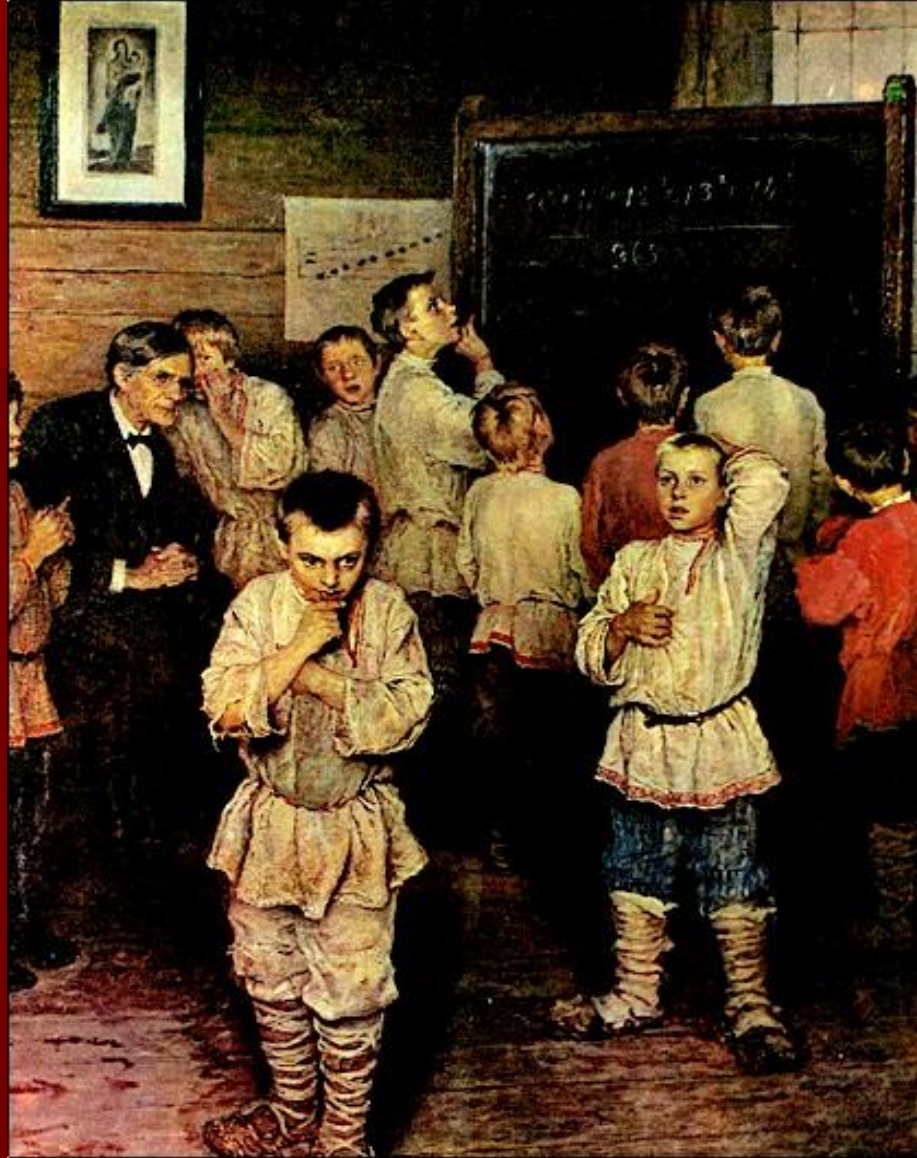
Н.П.Богданов – Бельский «Устный счёт»