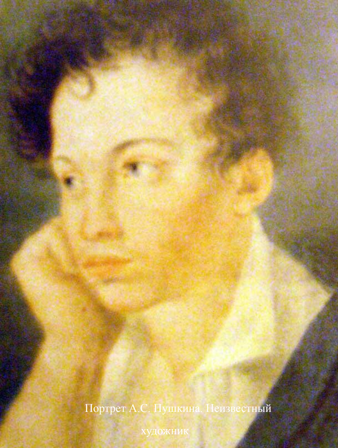
Портрет А.С. Пушкина. Неизвестный