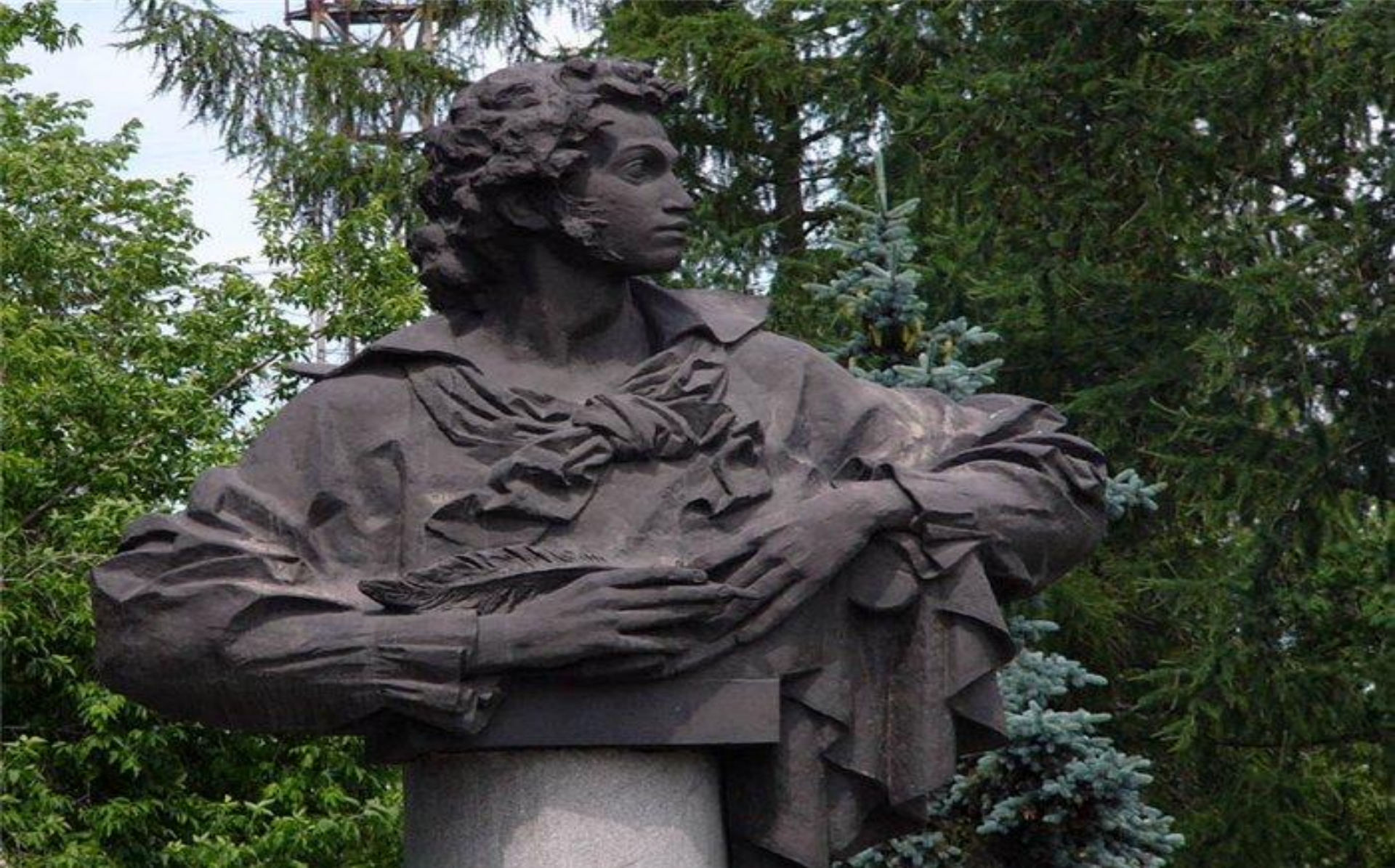
Челябинск. Парк им.Пушкина