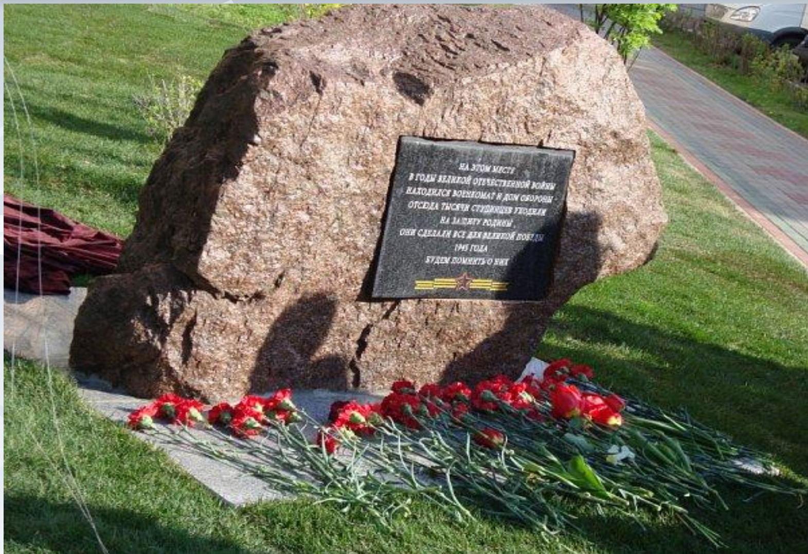
Памятный знак на улице Пушкина.