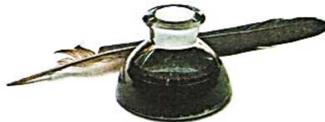
перо, чернила, чернильница