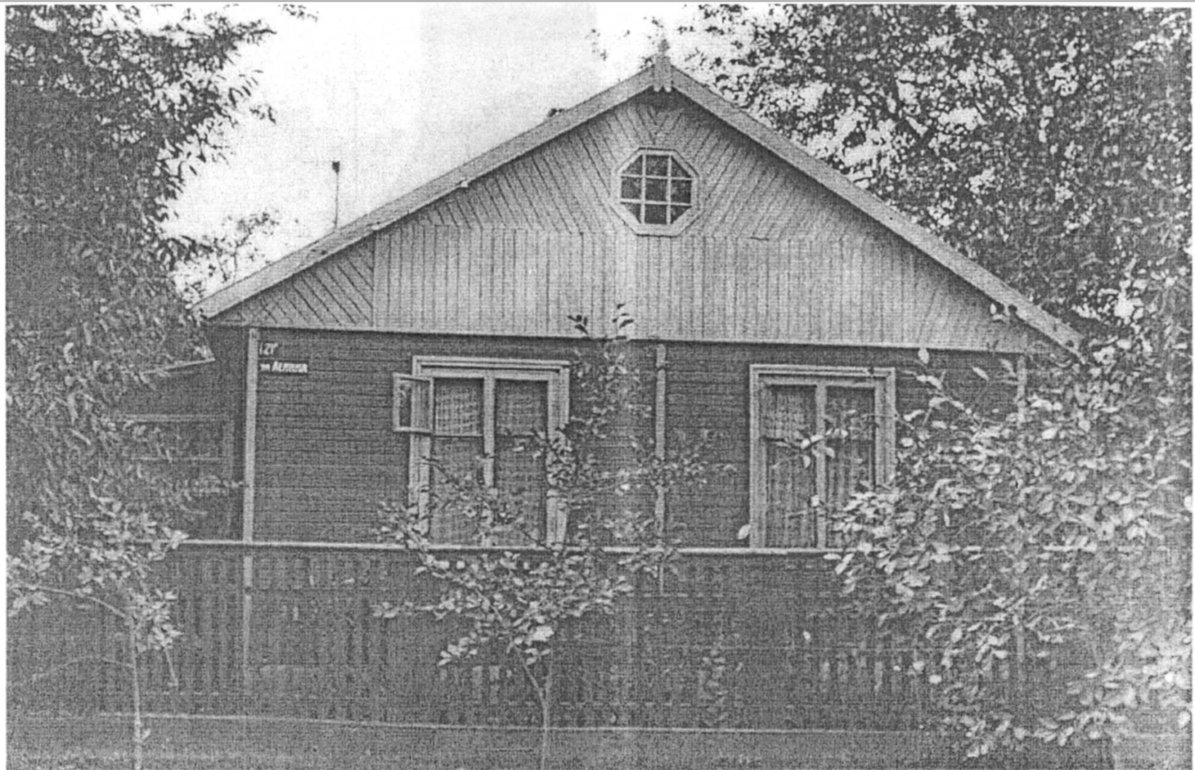
Дом в селе Красногвардейском в 60-70 годы XX века