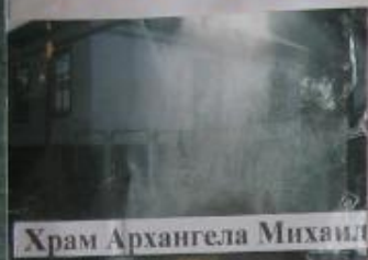
Храм Архангела Михаила