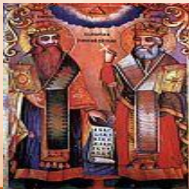
Св.Кирилл и Мефодий

«Кириллица» - славянская азбука, ставшая основой русской азбуки.