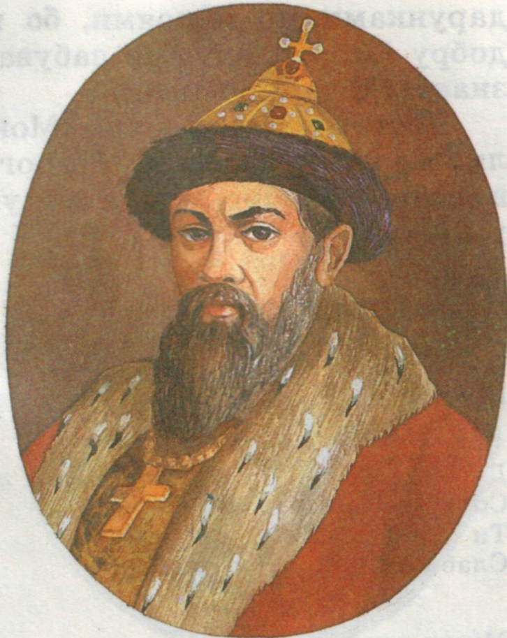
Князь Володимир Мономах

Юный историк: Ни одна эпоха не обходилась без правил и норм человеческого поведения и общения. Об этом можно прочесть в античных стихотворных поучениях, в «Одиссее» Гомера, в памятниках древнерусской литературы. Вот что говорится в «Почении» Владимира Мономаха, написанном еще в X веке. «Куда ни поедите, где ни остановитесь в пути, везде напоите и накормите всякого просящего; больше всего чтите гостя, откуда бы к вам ни пришел, угостите пищей или питием ... Больного посещайте, мертвого падите проводить так, как все мы смертны. Не пройдите мимо человека, не приветствуя его, а скажите всякому при встрече доброе слово ..»