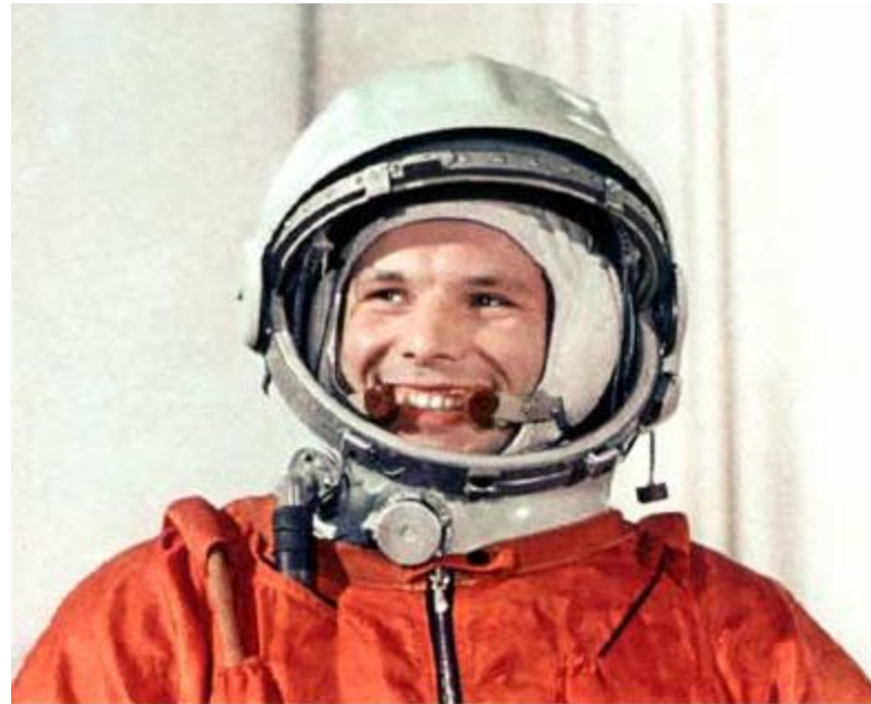
Гагарин Юрий Алексеевич

12 апреля 1961 года в Советском Союзе выведен на орбиту вокруг Земли первый в мире космический корабль-спутник "Восток" с человеком на борту.