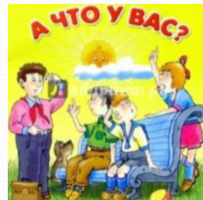
А что у вас?