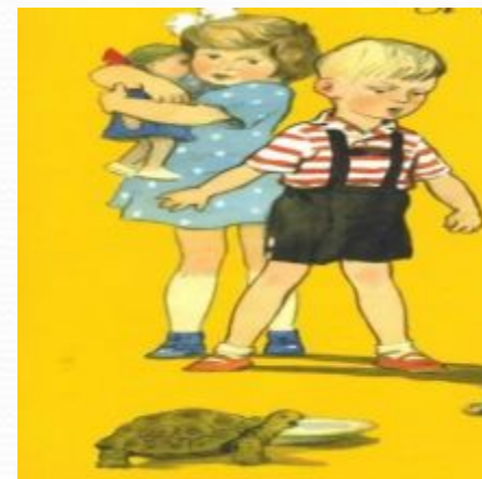
Вовка добрая душа