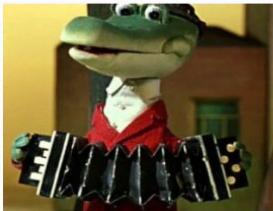
Крокодил Гена и его друзья