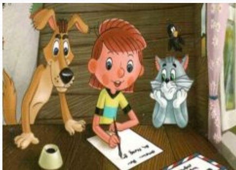
Дядя Федор, пес и кот