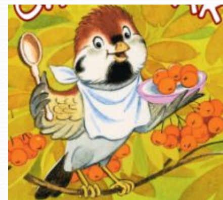
Где обедал воробей