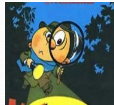
Колобок идет по свету