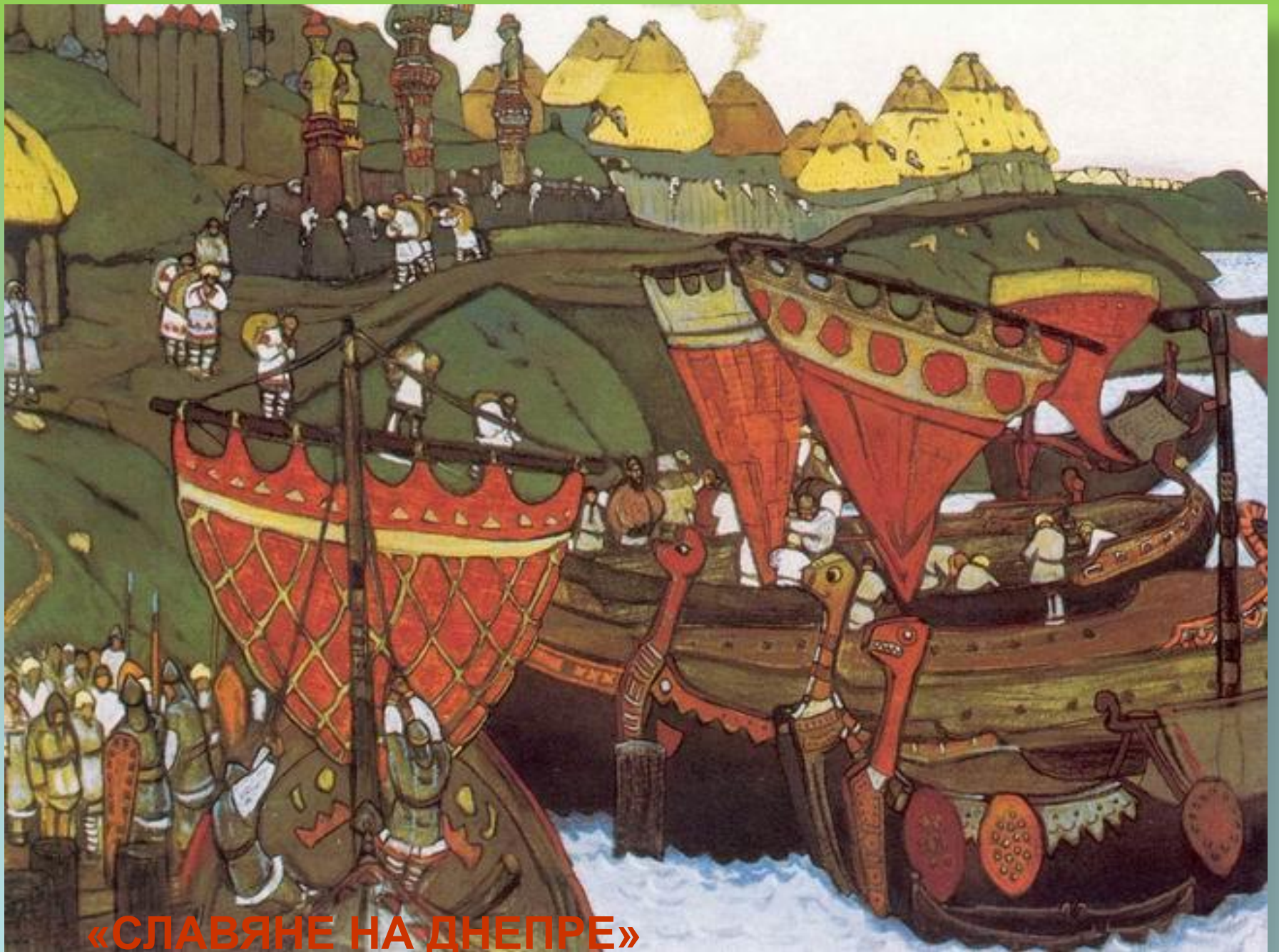
«СЛАВЯНЕ НА ДНЕПРЕ»