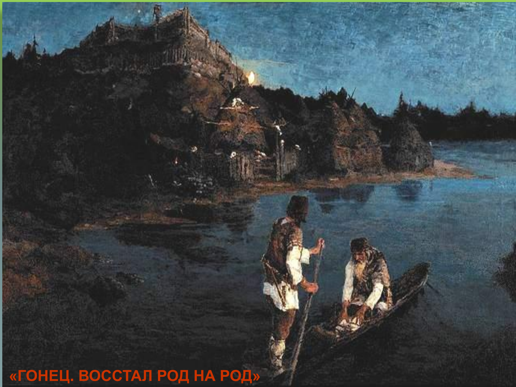
«ГОНЕЦ. ВОССТАЛ РОД НА РОД»