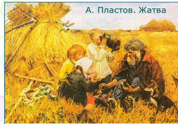
А. Пластов. Жатва