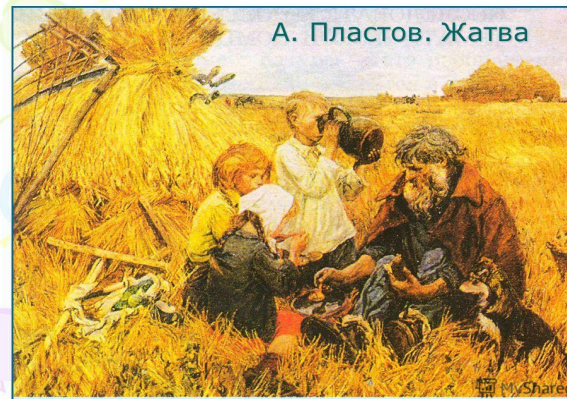
А. Пластов. Жатва