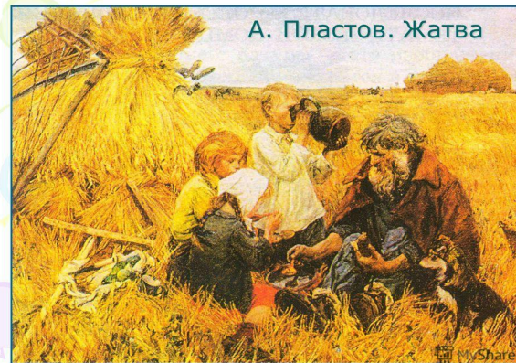
А. Пластов. Жатва