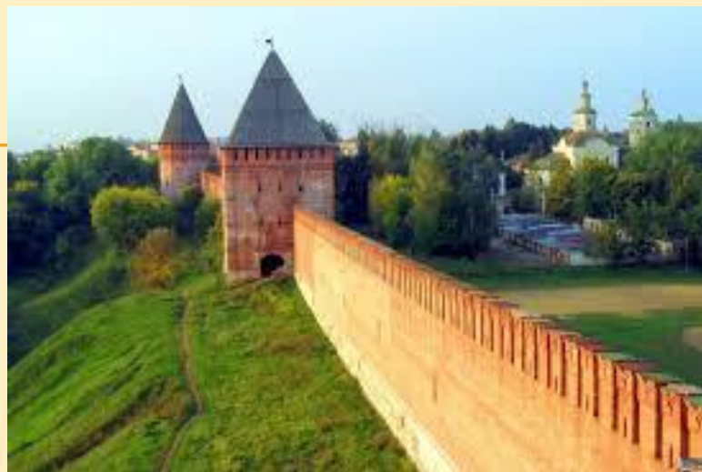
Г . СМОЛЕНСК