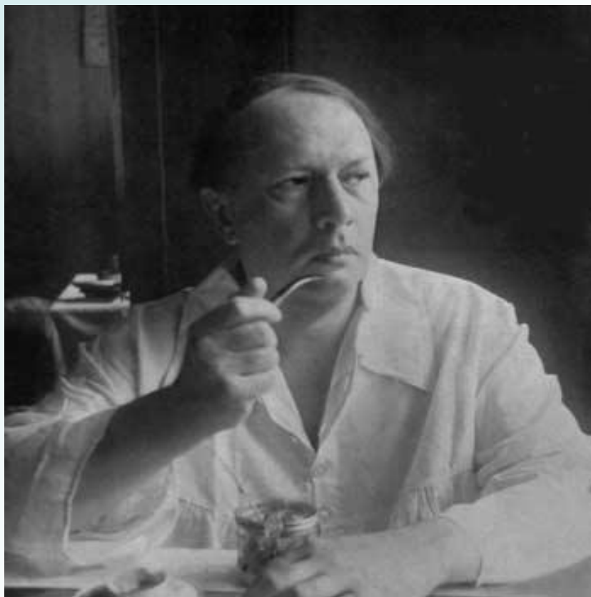
Алексей Николаевич Толстой ( 1883 – 1945 )