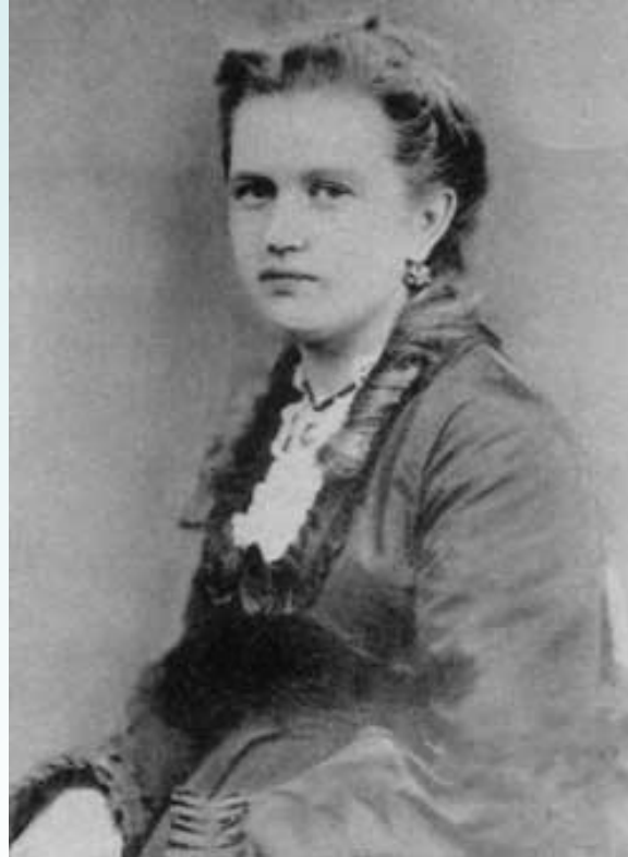
Александра Леонтьевна Толстая