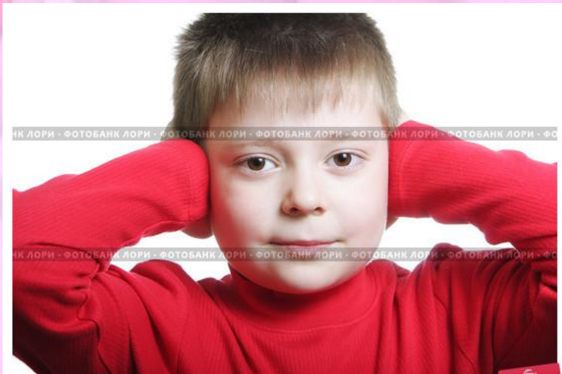
Мальчик закрыл уши руками