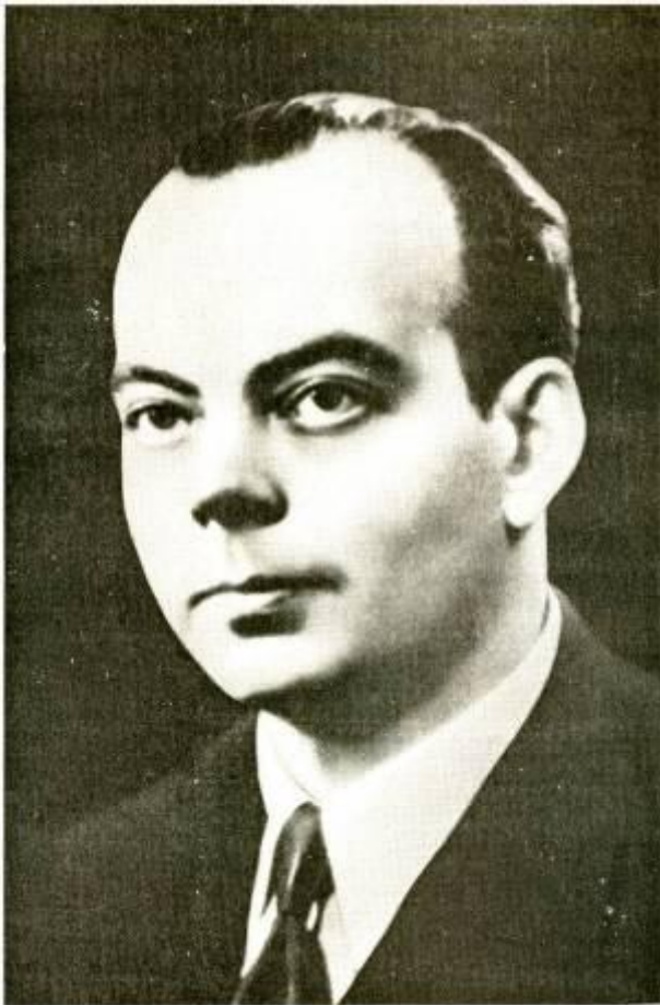
Антуан де Сент- Экзюпери (1900 – 1944)