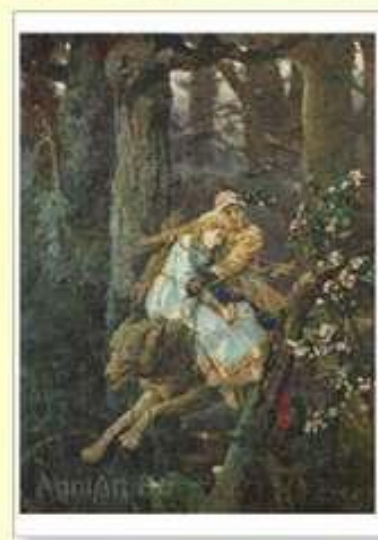
Иван –царевич и Серый Волк