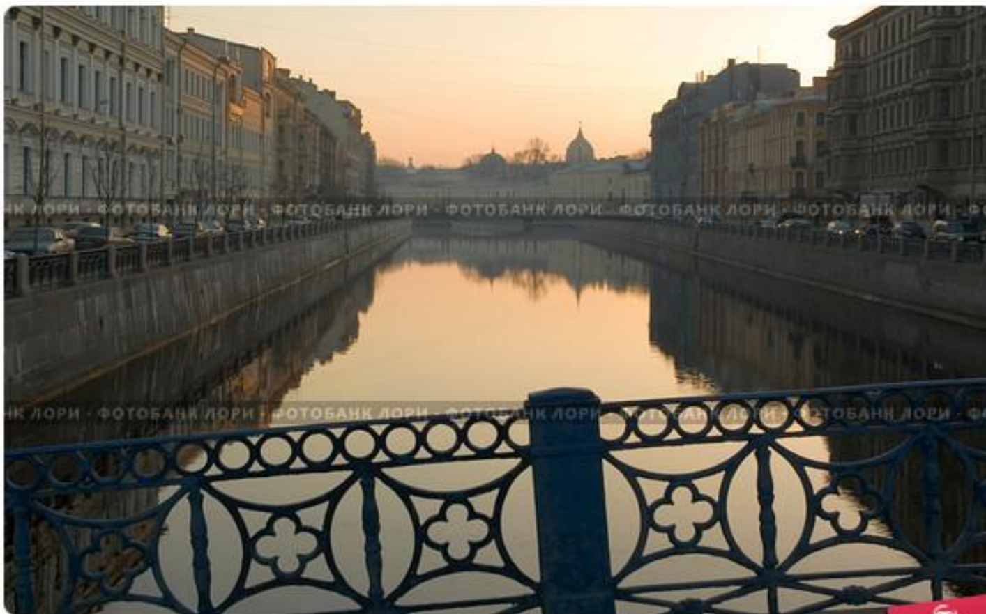
Санкт-Петербург. Весеннее утро на набережной Мойки. Вид с Синего моста