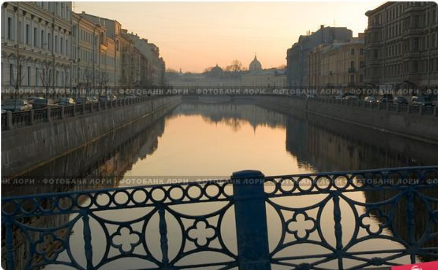
Санкт-Петербург. Весеннее утро на набережной Мойки. Вид с Синего моста