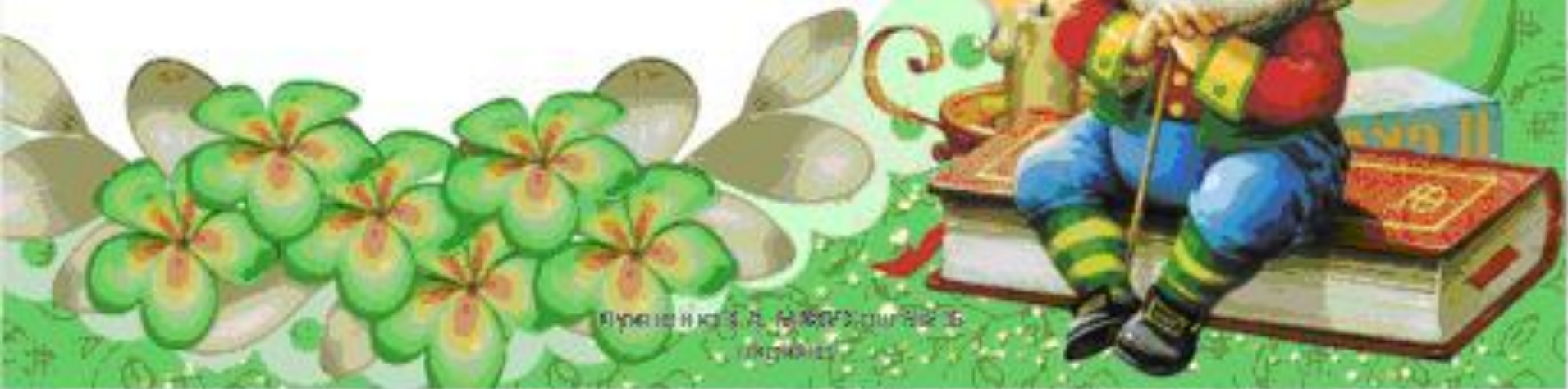
Иллюстрация к сказке Л. П. Пастернака «Сказка-ложь, да в ней намёк- добрым молодцам урок»