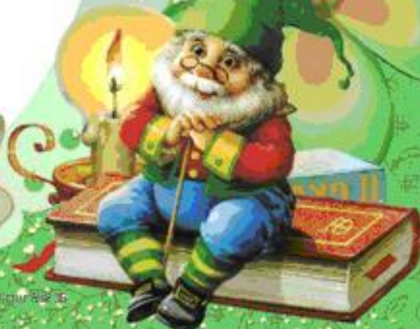
Иллюстрация к книге Л. Г. Волкова «Сказки про лишние буквы»