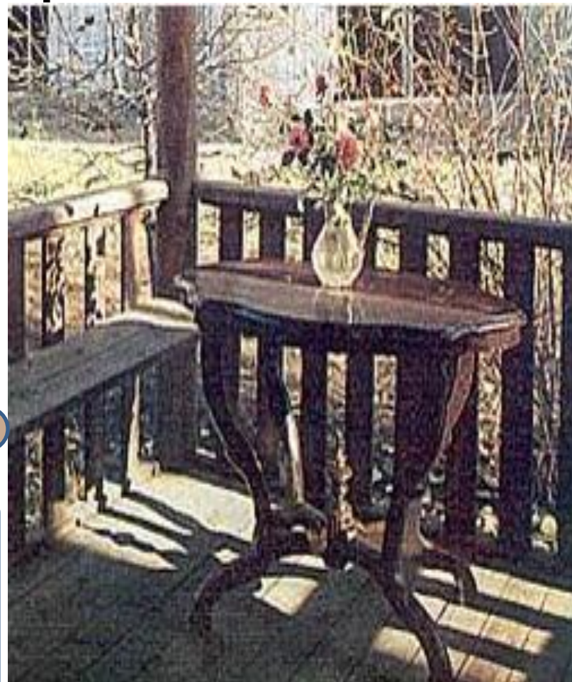
Дом-музей А.М.Герасимова. Терраса, на которой любил работать художник