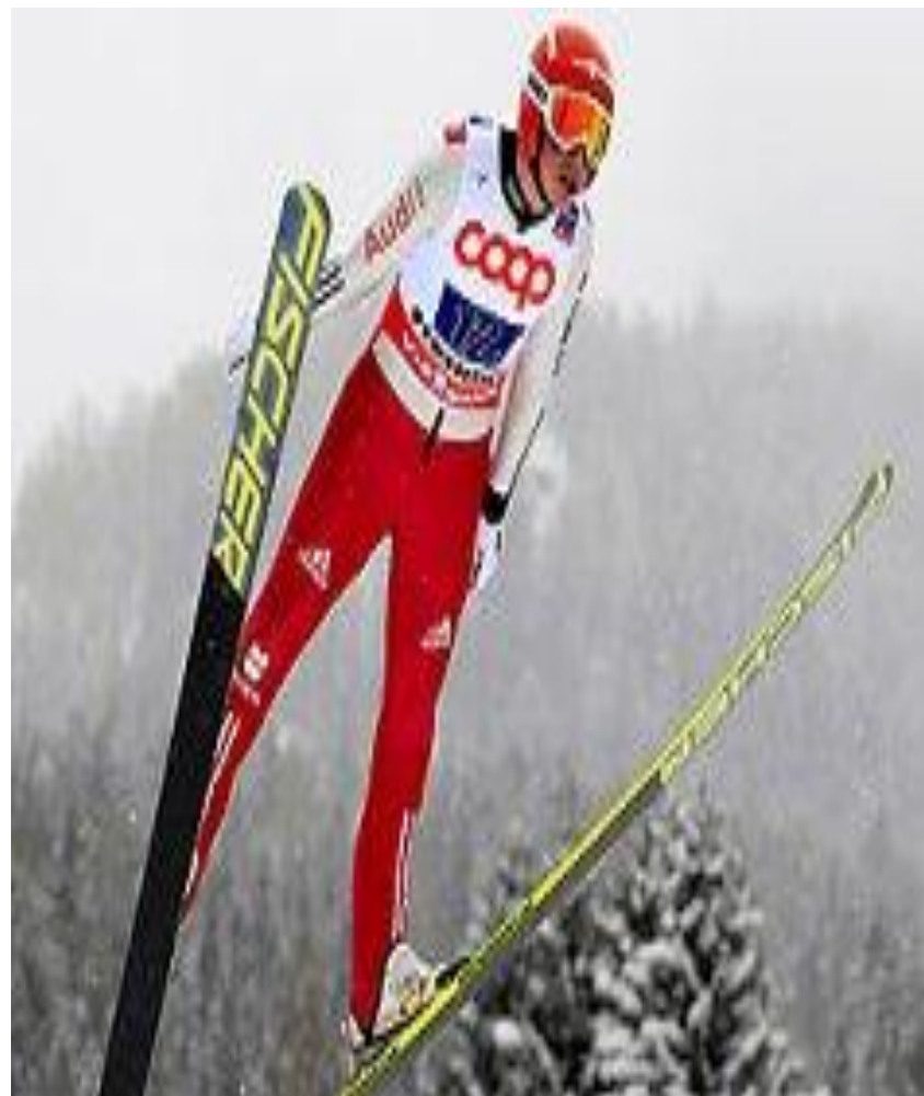
Прыжки с трамплина