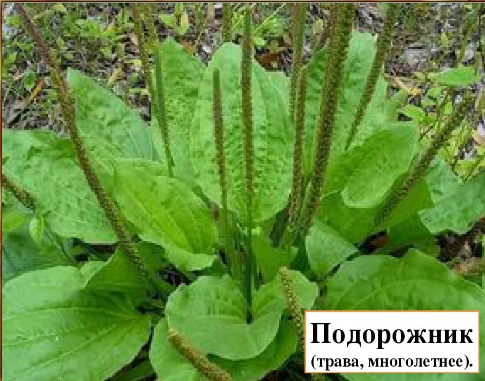
Подорожник (трава, многолетнее).