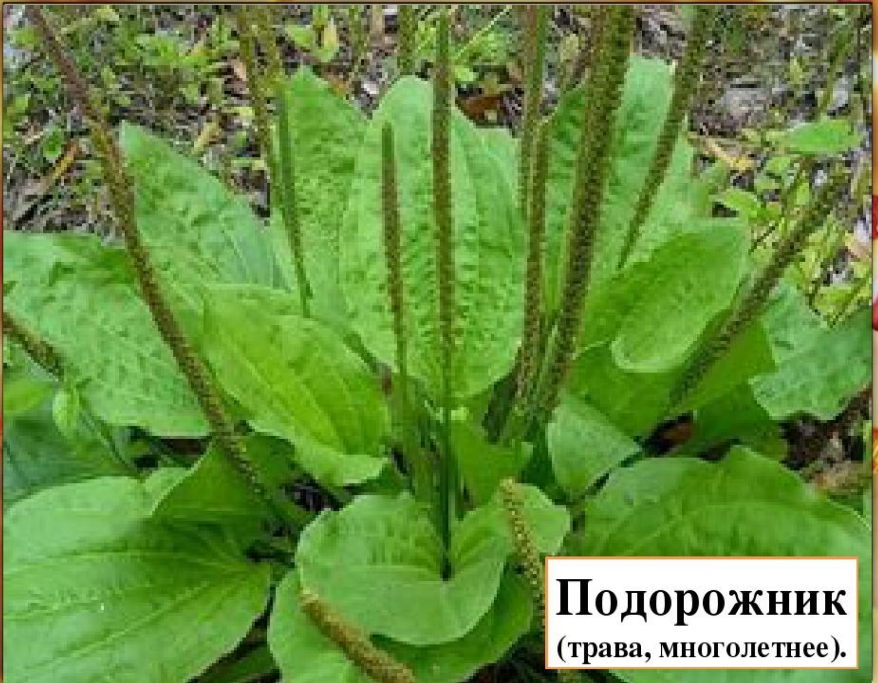
Подорожник (трава, многолетнее).