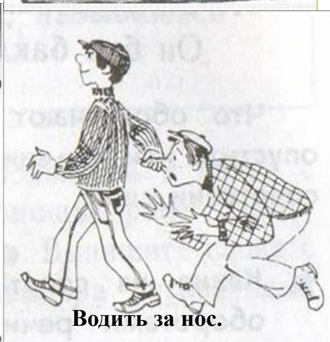
Водить за нос.