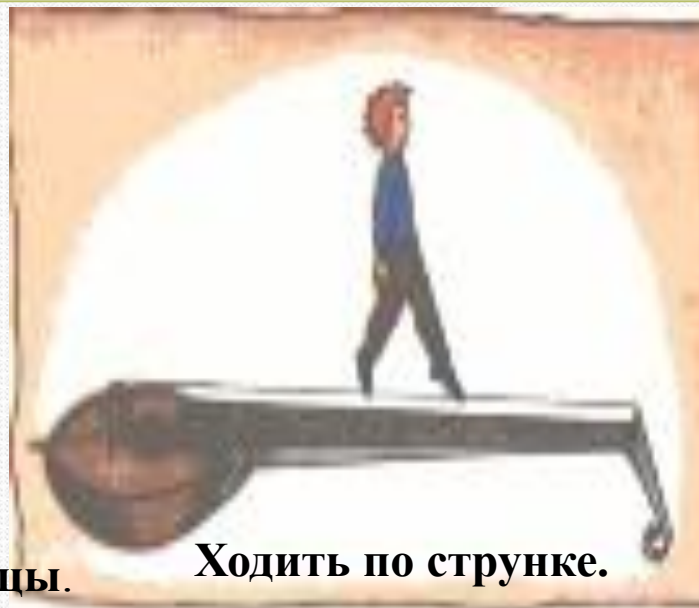
Ходить по струнке.