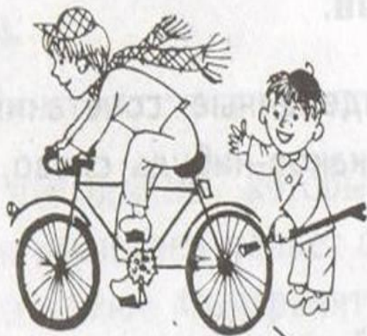
Вставить палки в колеса.