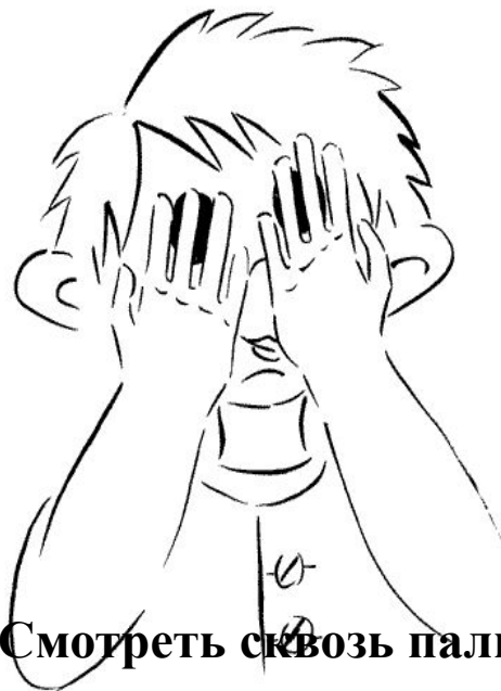
Смотреть сквозь пальцы.