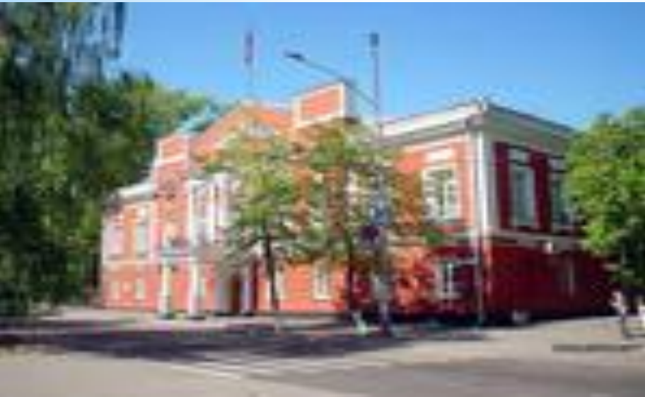
Здание администрации г. Барнаула