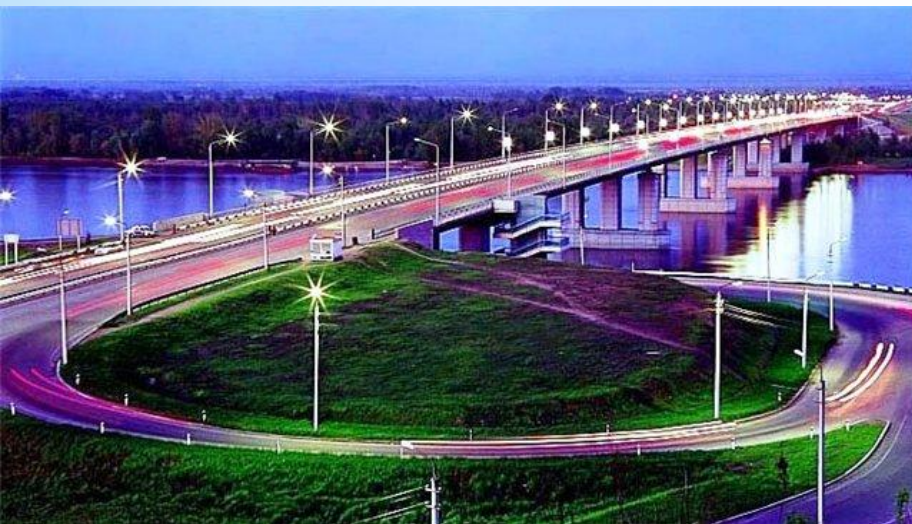
Мост через реку Обь