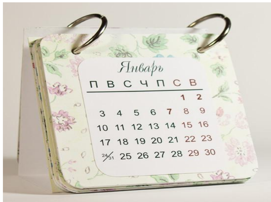
Календарь – м. р.

Под Новый год пришёл он в дом Таким румяным толстяком. Но с каждым днём терял он вес И, наконец, совсем исчез.