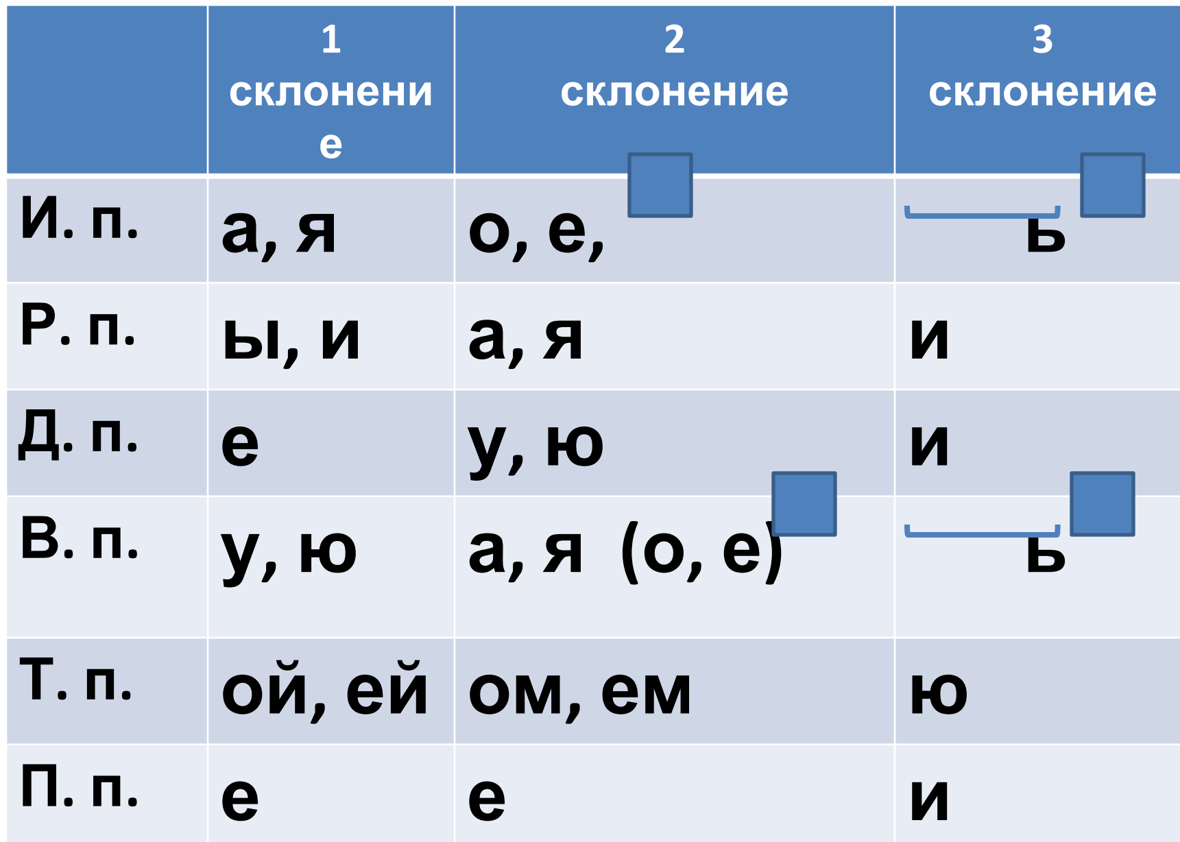
Таблица окончаний имён