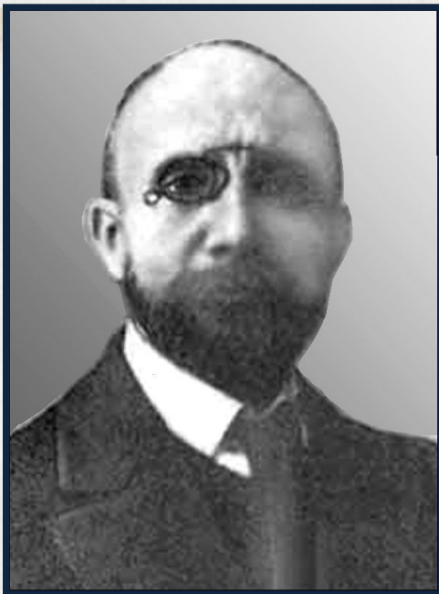
Игорь Эммануилович Грабарь 1871-1960