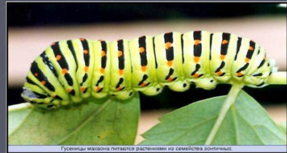
Гусеницы мавлона питаются растениями из семейства зонтичных