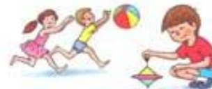
КОГО МНОГО? (ДЕТЕЙ)