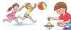
КОГО МНОГО? (ДЕТЕЙ)