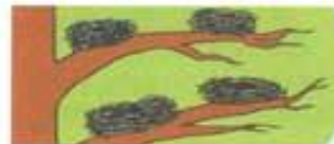
ЧЕГО МНОГО? (ГНЕЗД)