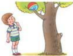
У КОГО НЕТ МЯЧА? (У МАЛЬЧИКА)