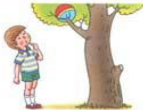
У КОГО НЕТ МЯЧА? (У МАЛЬЧИКА)