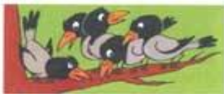
КОГО МНОГО НА ДЕРЕВЕ? (ВОРОН)