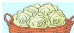
ЧЕГО МНОГО В КОРЗИНЕ? (КАПУСТЫ)