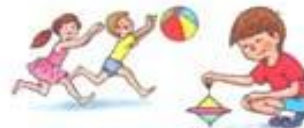
КОГО МНОГО? (ДЕТЕЙ)