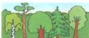
ЧЕГО МНОГО В ЛЕСУ? (ДЕРЕВЬЁВ)