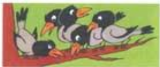
КОГО МНОГО НА ДЕРЕВЕ? (ВОРОН)