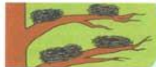
ЧЕГО МНОГО? (ГНЕЗД)