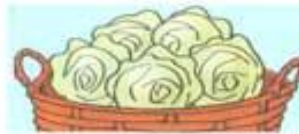
ЧЕГО МНОГО В КОРЗИНЕ? (КАПУСТЫ)