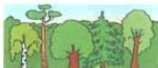
ЧЕГО МНОГО В ЛЕСУ? (ДЕРЕВЬЁВ)