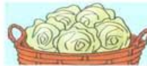
ЧЕГО МНОГО В КОРЗИНЕ? (КАПУСТЫ)