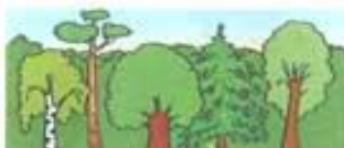
ЧЕГО МНОГО В ЛЕСУ? (ДЕРЕВЬЁВ)