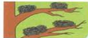
ЧЕГО МНОГО? (ГНЕЗД)