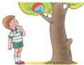
У КОГО НЕТ МЯЧА? (У МАЛЬЧИКА)