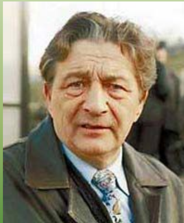
Эдуард Николаевич Успенский