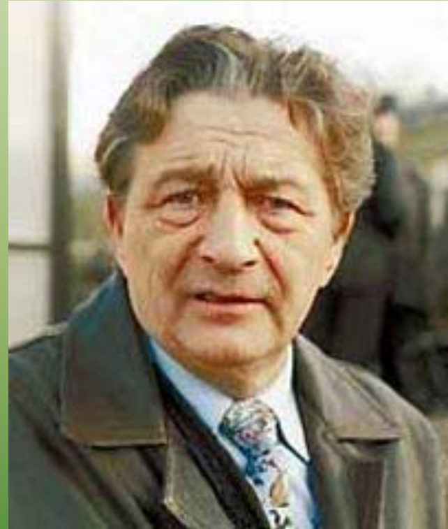
Эдуард Николаевич Успенский