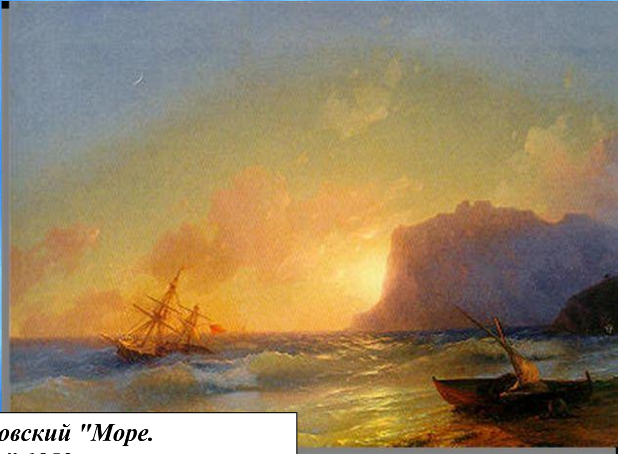
И.К.Айвазовский "Море. Коктебель" 1853г.