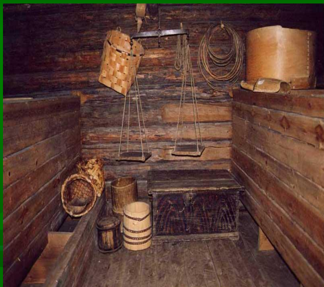
Сусек-ларь, большой деревянный ящик, в котором хранили муку, зерно