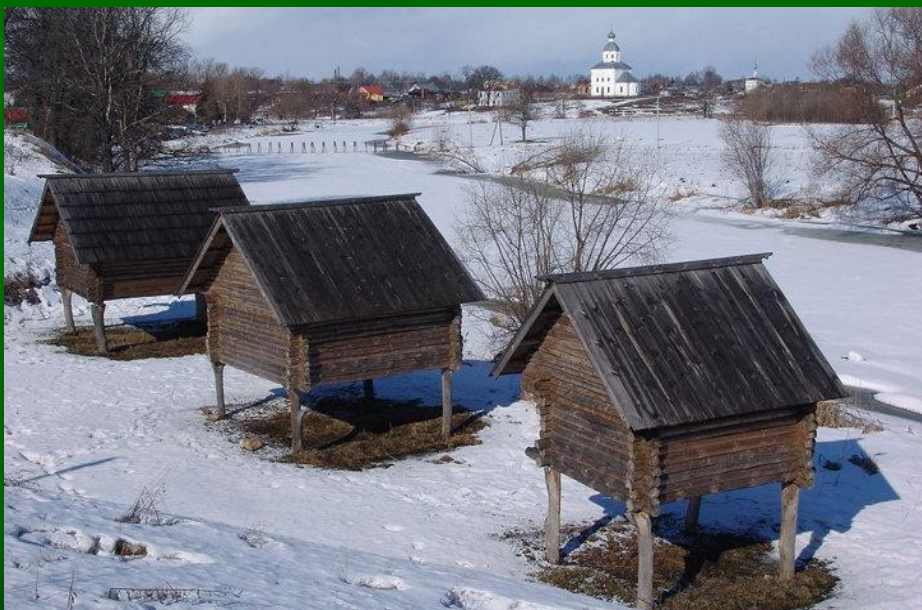
Амбар сооружение для хранения зерна, муки и др. Строится из брёвен. Деревянный пол с двойным настилом устраивают на столбиках из брёвен для доступа воздуха снизу.