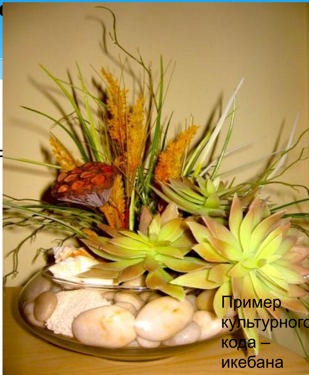
Пример культурного кода — икебана (язык цветов)

Культурные коды — исторически сложившиеся разнообразные системы знаков, которые активно использовались в определённую культурно— историческую эпоху