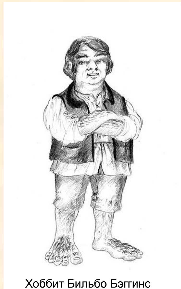
Хоббит Бильбо Бэггинс