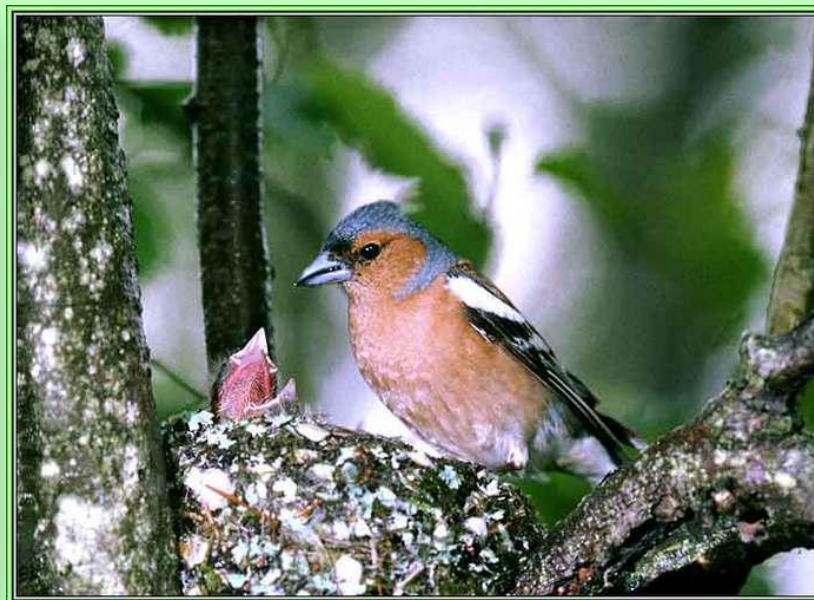
Эта птица у гнезда - зяблик