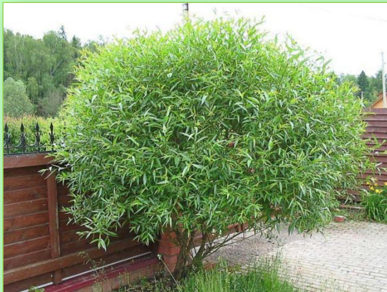
Это дерево - ива