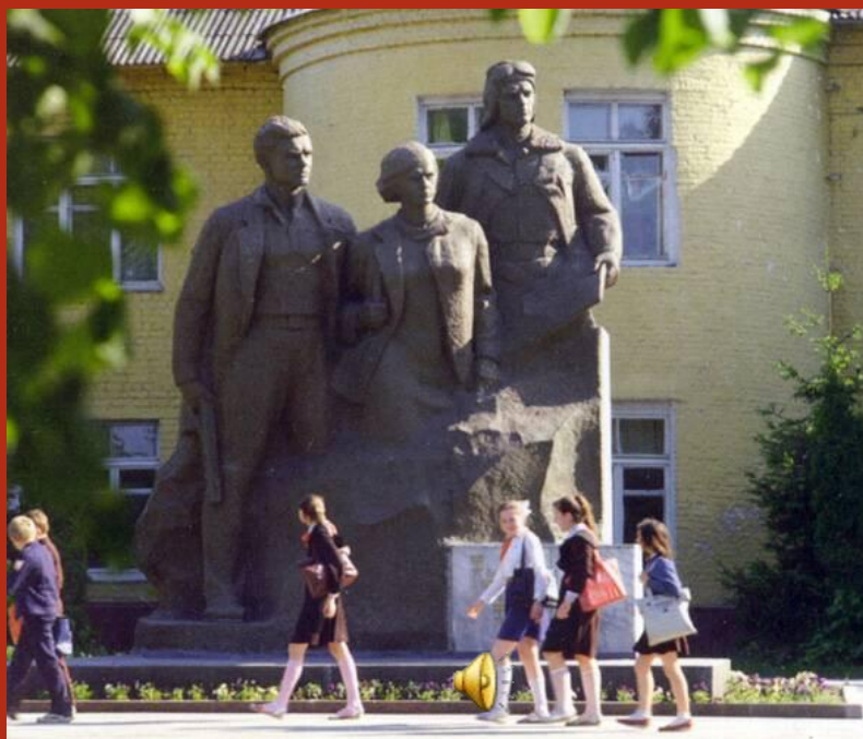
⦿ Памятник партизанам в сквере у школы 27