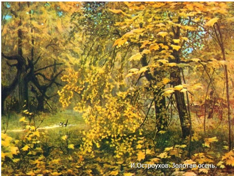
И.Остроухов. Золотая осень.

Какова цветовая палитра? Какие цвета преобладают? Что общего у этих картин?