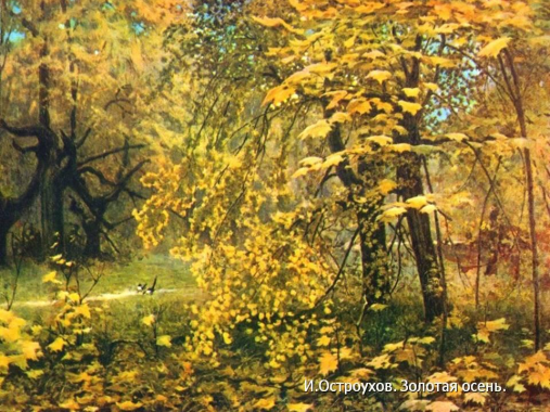
И.Остроухов. Золотая осень.