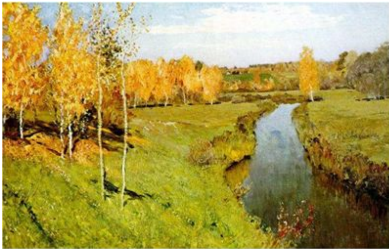
Золотая осень И.И.Левитан