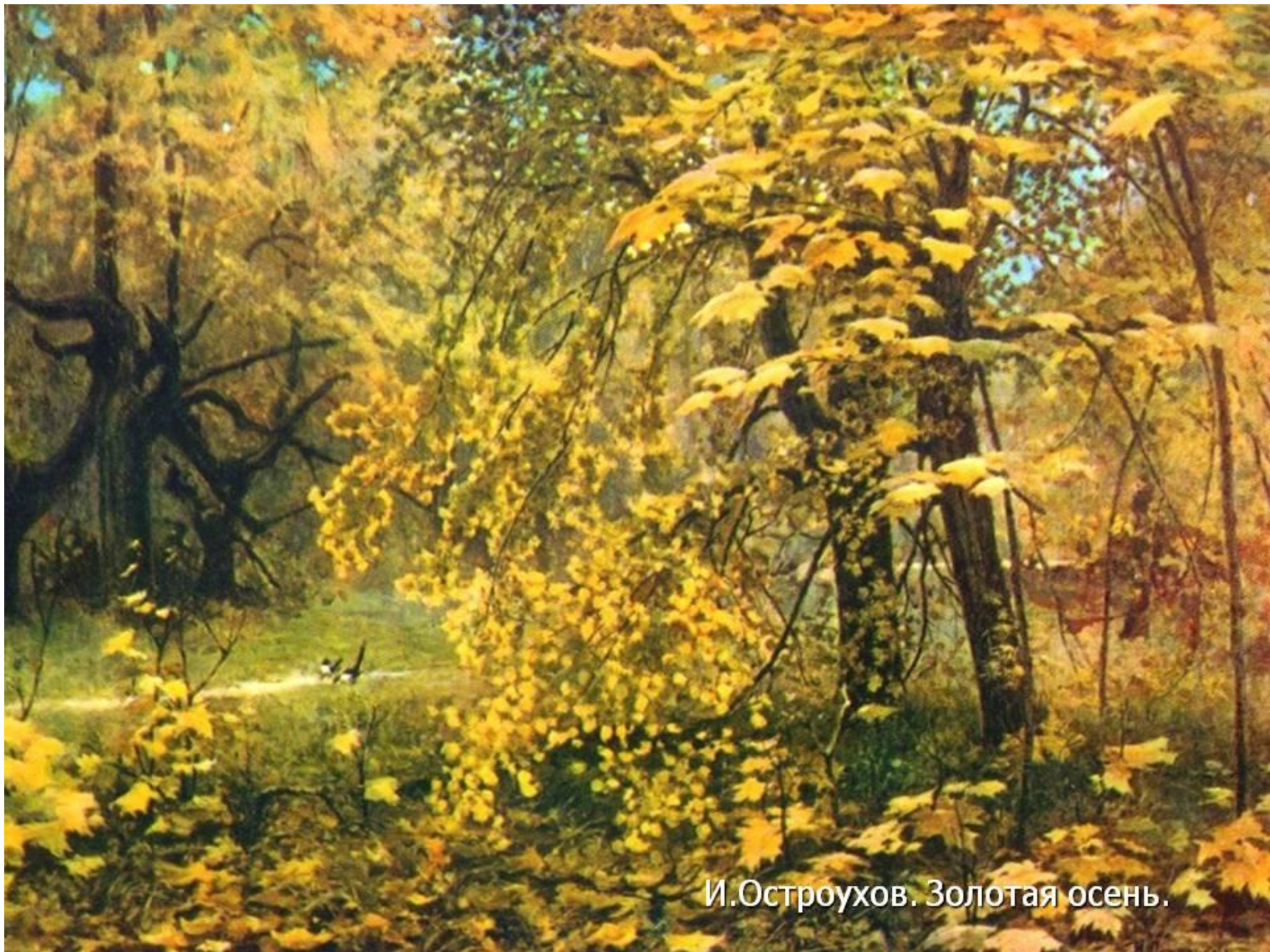
И.Остроухов. Золотая осень.