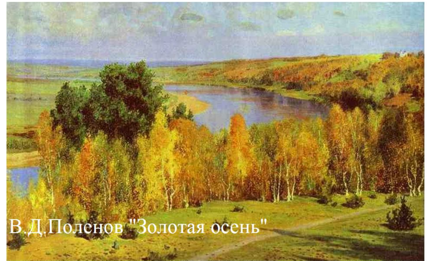
В. Д. Поленов "Золотая осень"