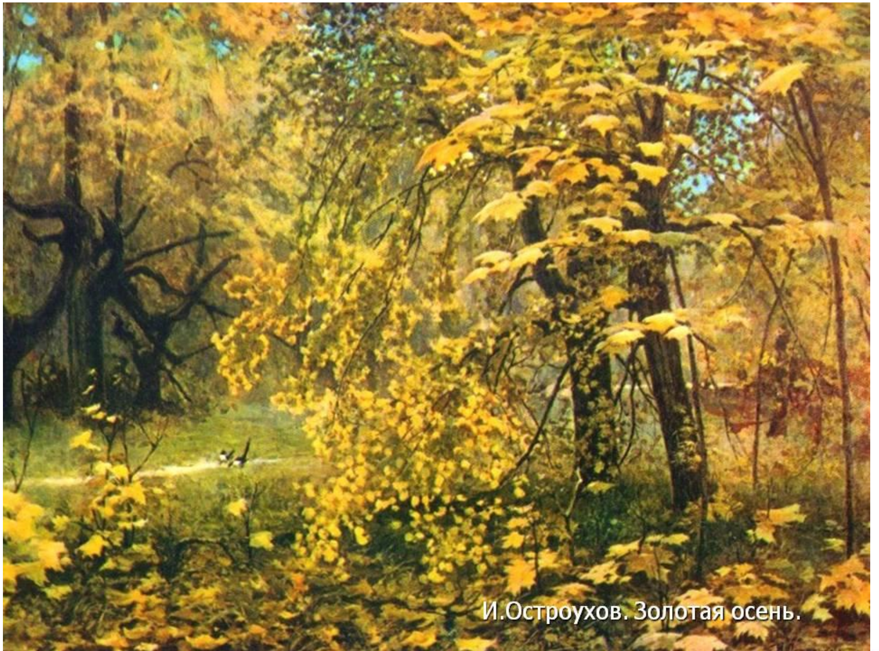
И.Остроухов. Золотая осень.