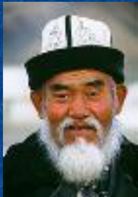
Абдулла, узбекский поэт

Если ты хочешь судьбу переспорить, Если ты ищешь отрады цветник, Если нуждаешься в твёрдой опоре – Выучи русский язык!