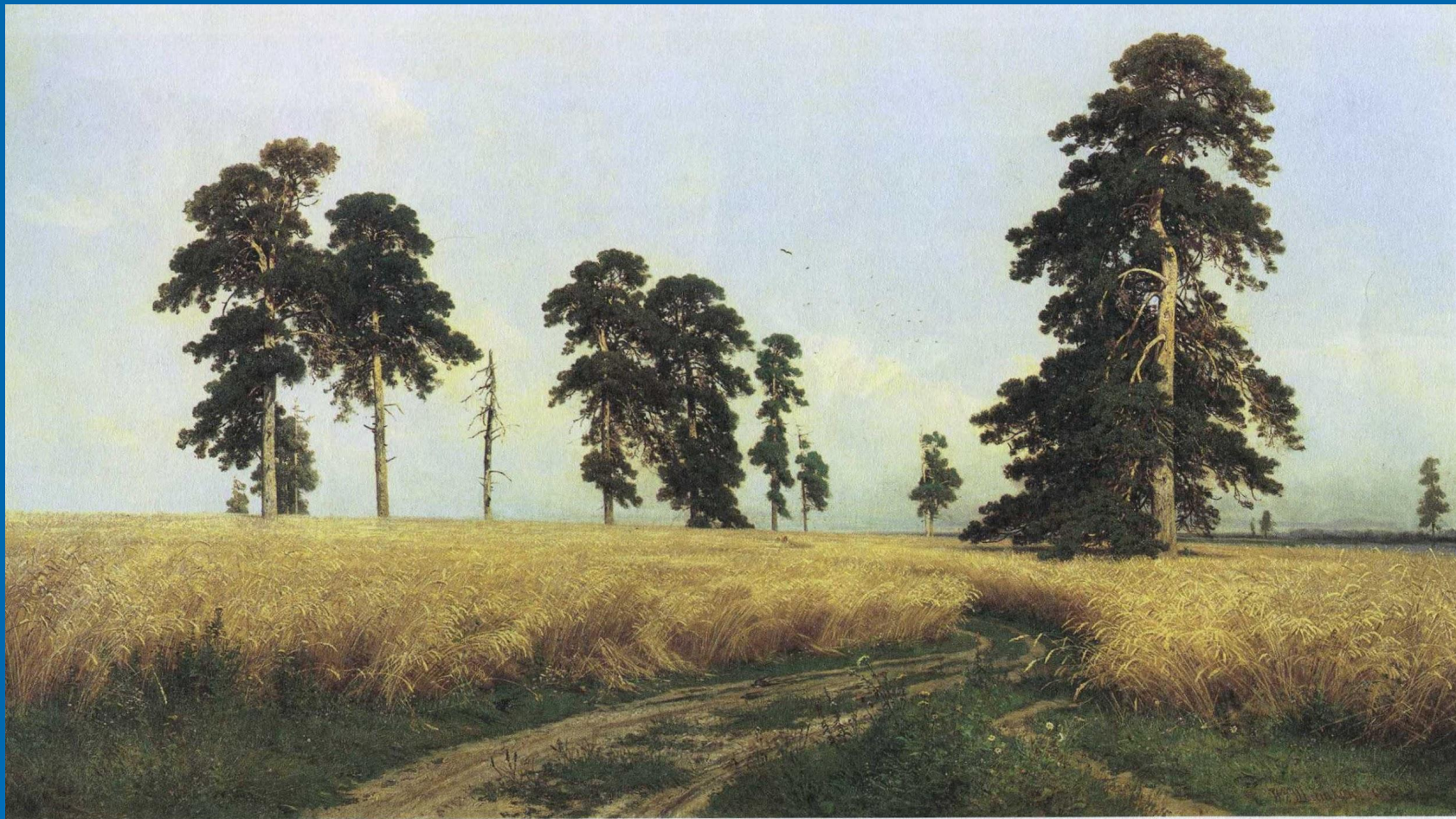
И.И ШИШКИН «РОЖЬ»