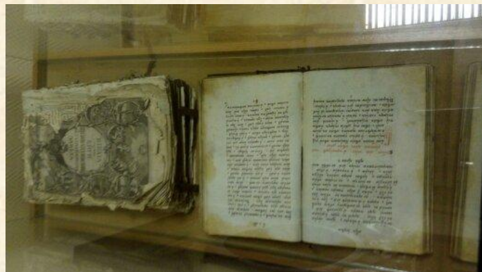
Посещение Краеведческого музея