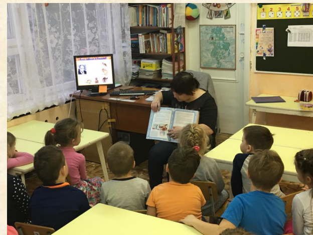
Просмотр презентации «Из чего состоит книга»